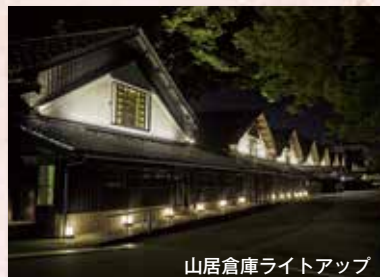
山居倉庫ライトアップ