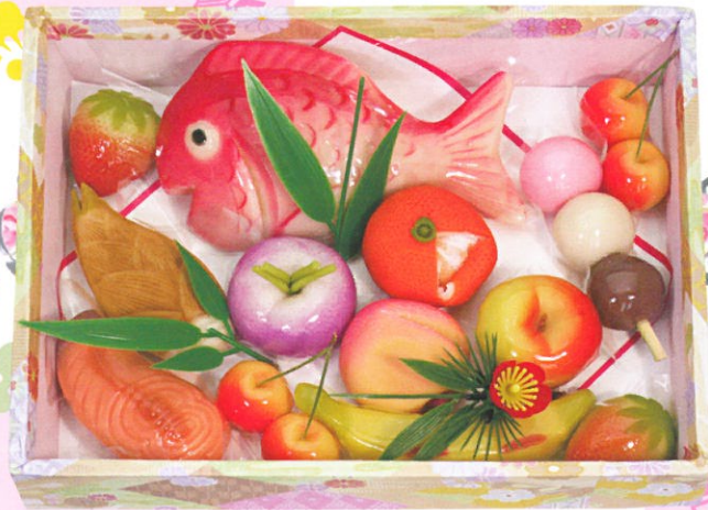
お雛菓子(箱入:大) 3,675円