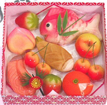
お雛菓子(箱入:中) 2,730円