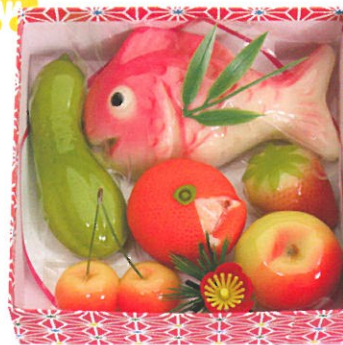
お雛菓子(箱入:小) 1,890円