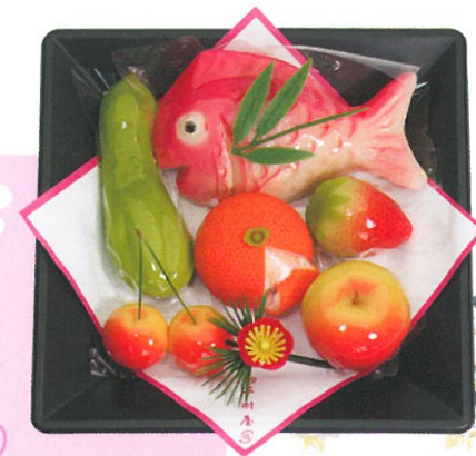
お雛菓子(パック入) 1,722円