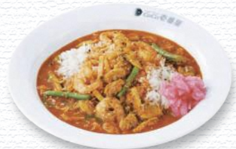
CoCo 壺番屋 / 鶴岡市