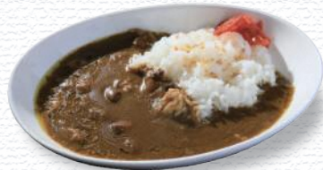
ル・ポットフー / 酒田市, 三川町