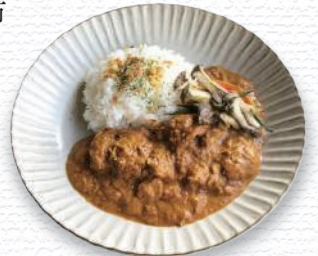
バックナリア Bacchanalia / 酒田市