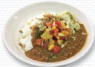
遊佐カレー / 遊佐町