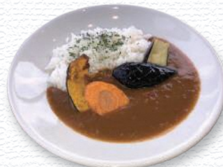
窪畑ファーム / 鶴岡市