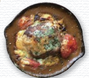
カフェスリーピース cafe threepeace / 酒田市