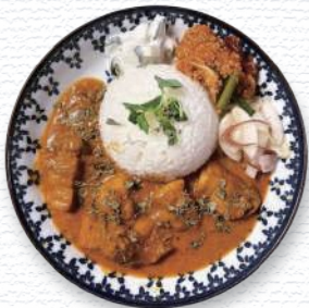
ハラダのカレー / 庄内町