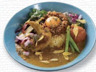
インディ CURRY BAR INDIE / 酒田市

新食感のブランド米 「雪若丸」を 庄内のカレーで堪能。 各店自慢のイチオシカレーを 食べくらべ。