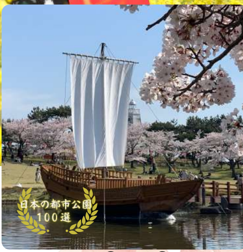
日本の都市公園100選