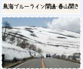
鳥海ブルーライン開通・春山開き