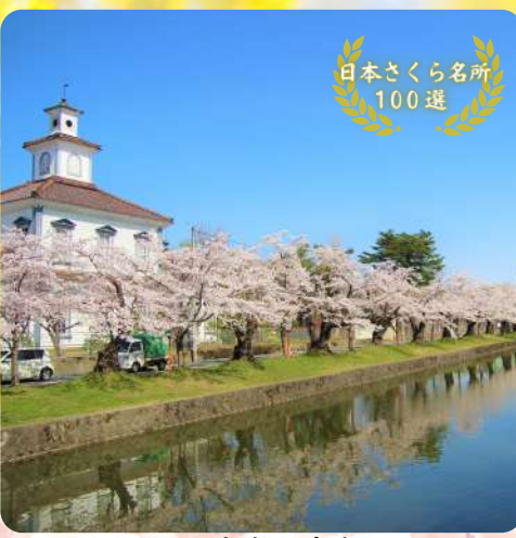
日本さくら名所100選