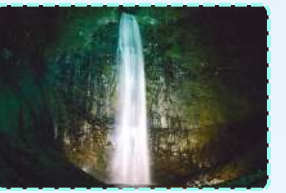
玉簾の滝ライトアップ