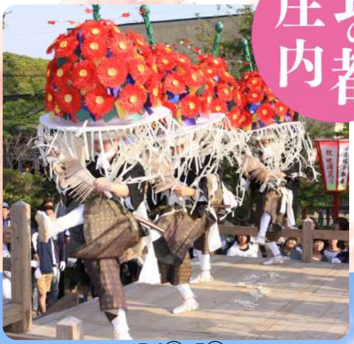
5.4(土)～5(日) 鳥海山大物忌神社 吹浦口ノ宮例大祭 吹浦田楽 花笠舞 (遊佐町)