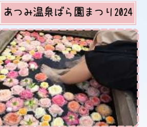
あつみ温泉ばら園まつり2024