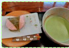
箏演奏と御抹茶の会

黒川能の里王 祇会館 ☎0235-57-5310 清川歴史公園 ☎0234-25-5885 東陽コミュニティ振興会 ☎0234-54-2292 鼠ヶ関自治会 ☎0235-44-2112 最上峽芭蕉ライン観光(株) ☎0233-72-2001 遊佐町役場企画課観光物産係 ☎0234-72-5886 酒田市交流観光課 ☎0234-26-5759 鳥海高原家族旅行村 ☎0234-64-4111 酒田市松山総合支所 ☎0234-62-2611 山五十川公民館 ☎0235-45-2949 黒川能の里王 祇会館 ☎0235-57-5310 羽黒町観光協会 ☎0235-62-4727 酒田市農林水産課水産振興係 ☎0234-26-5753 出羽三山神社社務所 ☎0235-62-2355 NPO法人田舎体験塾つのかわの里 ☎0233-73-8051 あつみ観光協会 ☎0235-43-3547 NPO法人田舎体験塾つのかわの里 ☎0233-73-8051 NPO法人田舎体験塾つのかわの里 ☎0233-73-8051 酒田市八幡総合支所 ☎0234-64-3111