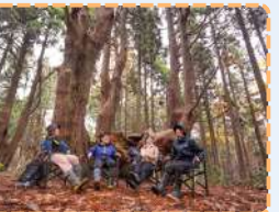
幻想の森トレッキング & チェアリング体験