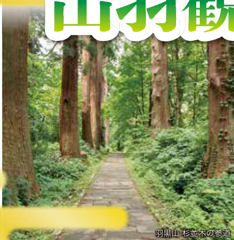
羽黒山 杉並木の参道