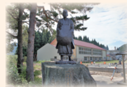
清川関所跡・芭蕉像

清川関所跡は日本遺産「自然と信仰が息づく『生まれかわりの旅』」の構成文化財です。