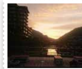
86 温海温泉郵便局 温海温泉の夕景