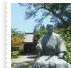
45 清川郵便局 清河八郎銅像