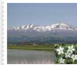
5 遊佐郵便局 鳥海山とチョウカイフスマ