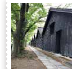
29 酒田山居町郵便局 山居倉庫