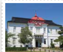
63 鶴岡郵便局 大宝館