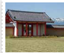
14 上田郵便局 政庁南門と鳥海山