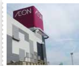
47 イオンモール三川内郵便局 令和元年6月10日に開局したばかり。 県内初のショッピングモール内郵便局