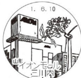
イオンモール三川内郵便局 令和元年6月開局した 風景印

風景印は町のシンボルや歴史やキャラクターがモチーフになっています。 庄内地方は、自然豊かで歴史ロマンを感じる地域です。 歴史印で新たな「庄内」の魅力を発見してみませんか？