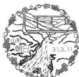
朝日郵便局 特産のヤマブドウを かわいく装飾！