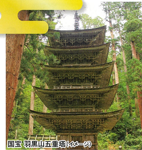
国宝 羽黒山五重塔(イメージ)