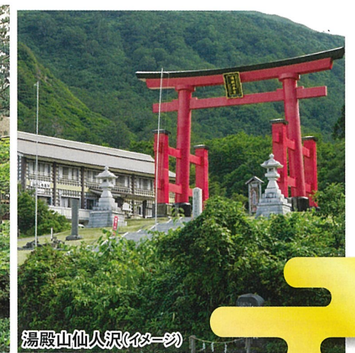
湯殿山仙人沢(イメージ)