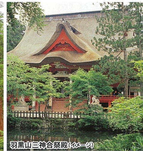
羽黒山三神合祭殿(イメージ)