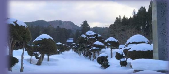
山形県指定天然記念物 きのご杉群

国指定名勝庭園を有し、 庄内三十三観音の巡礼地の一つでもある總光寺。 雪の庭園で、プロジェクトマッピングをお楽しみください。