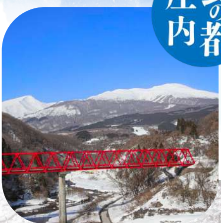
冬の絶景スポット 月光川大橋(遊佐町)