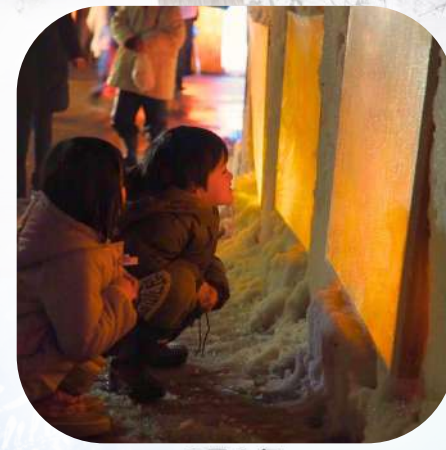
2月上旬 角川雪回廊物語(戸沢村)