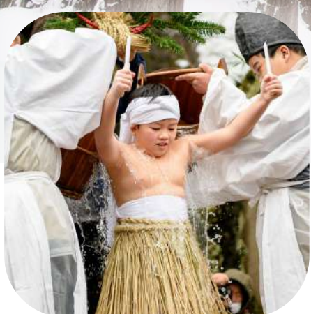
1月12日(日) ややまつり(庄内町)