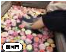
あつみ温泉ばら園まつり キャンペーン