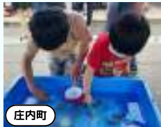
しょうない金魚まつり