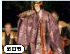
花の能 羽州庄内松山城 「薪能」