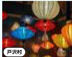
高麗館 ランタンフェス