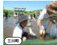
三川誕生70周年記念事業イベント 「パルク赤川であそぼう」